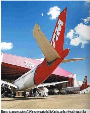
Hangar da empresa aérea TAM no aeroporto de São Carlos, onde aviões são reparados

Para ele, São Carlos passa a ser "referência para a região".